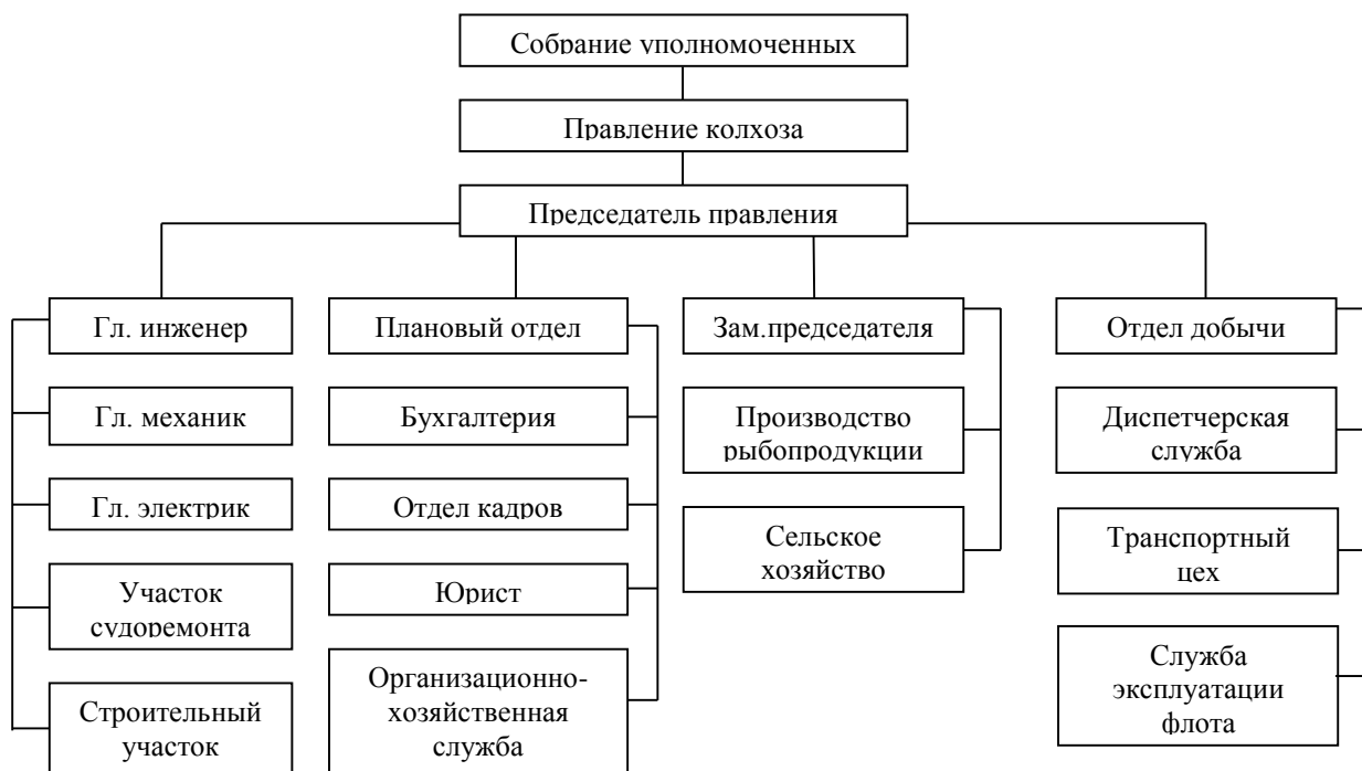
Рисунок 2 – Схема структуры аппарата управления рыболовецкого колхоза «Жемчужина моря»

В описании схемы приводится краткое описание подразделений основного производства, их состав и функции, численность персонала. При описании подразделений вспомогательного производства и обслуживающего хозяйства следует указать выполняемые функции, связь с